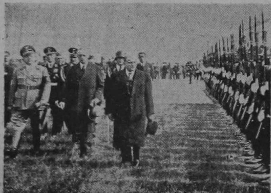
Llegada del Premier Daladier al aeropuerto de Munich.

La ampliación, que se hará en un lote propiedad del Estado, contiguo al edificio de la corte, hacia el oeste, constará de diez oficinas. Habrá campo suficiente para instalar una de las tres salas, ya sea la de casación o la civil o penal; esto se determinará una vez finalizada la ampliación. El costo de la obra será de setenta mil colones, según los planos levantados por la respectiva dependencia oficial.