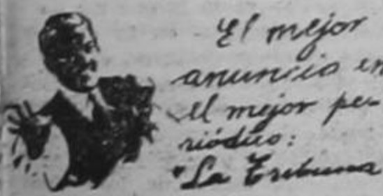
el mejor anuncio en el mejor periódico: "La Tribuna"

Fue ayer cuando el abogado en cuestión presentó un pliego rebatiendo los cargos que le hace Beltrán, sindicándolo como la persona que lo puso en contacto con las otras tres personas que se señalan como sindicadas de complicidad e instigación de la horrible tragedia del 23 de agosto.