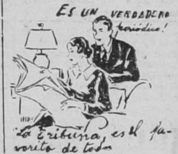
ES UN VERDADERO periódico! "La Tribuna" es el favorito de todos

se de una papeleta extendida por el representante diplomático a consular alemán en la ciudad donde se encuentra. Además se efectuarán elecciones a bordo de los barcos alemanes fuera del límite territorial de los países donde radican los sudetinos.