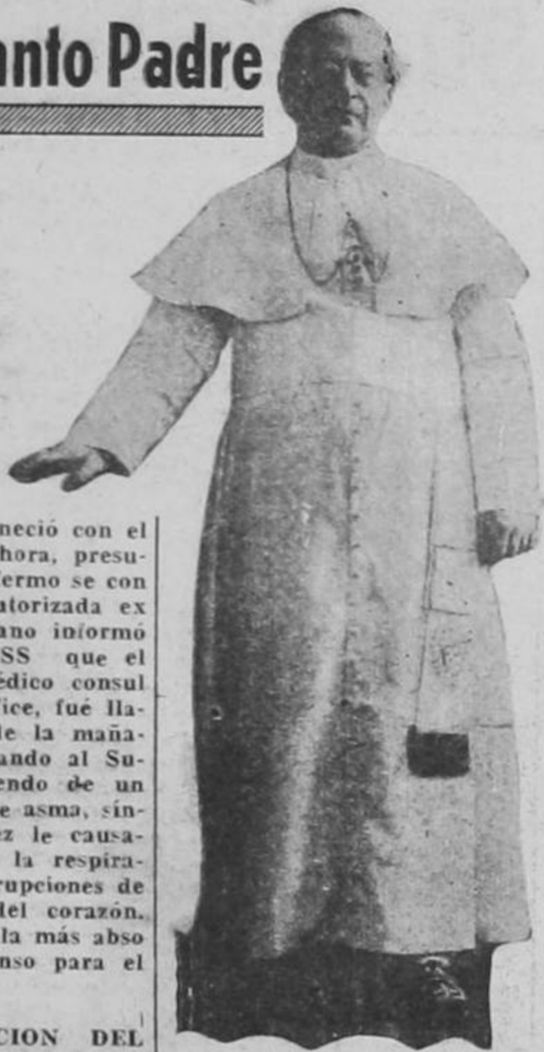
SU SANTIDAD EL PAPA

SERIA LA CONDICION DEL SU SANTIDAD EL PAPA— Pasa a la Pág. 8